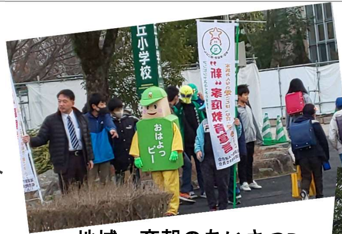
地域一斉朝のあいさつDay