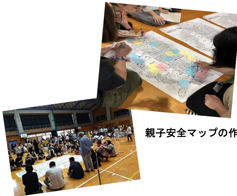
親子安全マップの作成