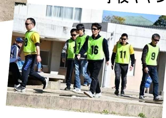
親子イベント「ミッションインポッシブル」