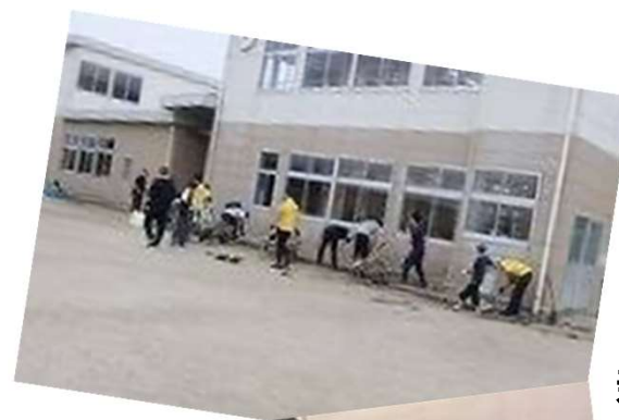
親子クリーン大作戦