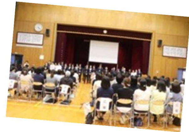
P T A 総会