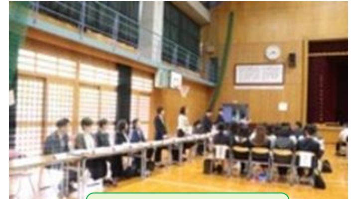
P T A 総会

学校と協力し各委員会のサポート・学校役員、各委員会委員長と協力し、子どもたちや保護者のより良い活動について考え、それを遂行する。