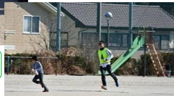
親子イベント 「ミッションインポッ シブル」