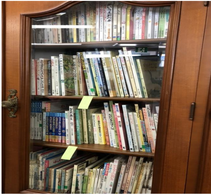
令和元年度購入の一部