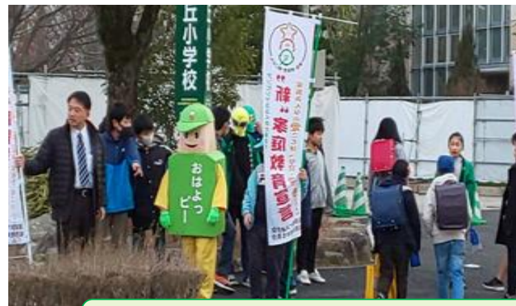
地域一斉朝のあいさつDay