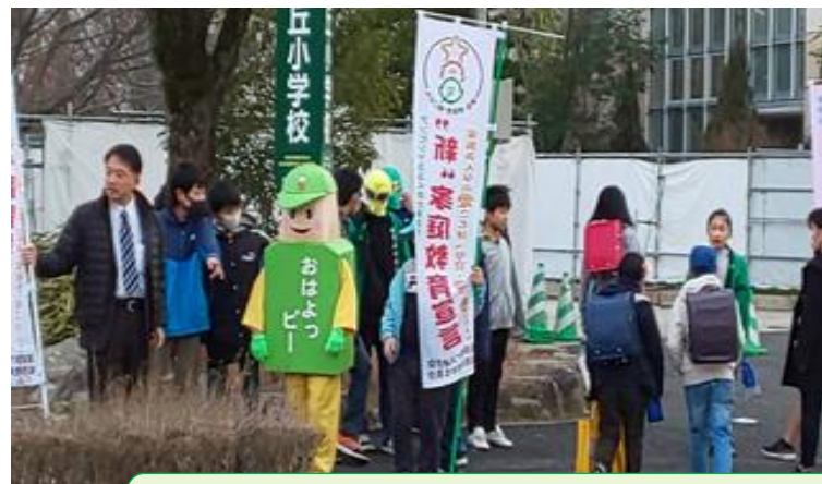
地域一斉朝のあいさつDay