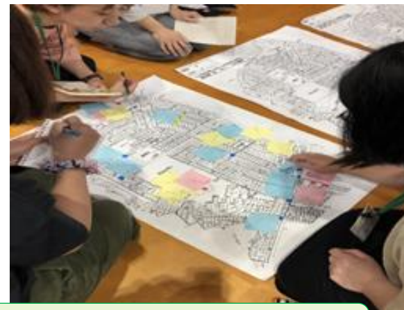
親子安全マップの作成