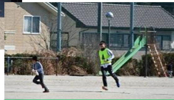
親子イベント 「ミッションインポッシブル」