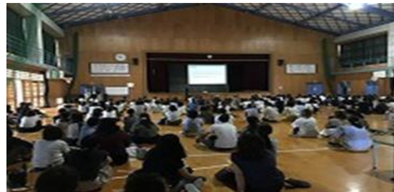
PTA役員選考方法説明会