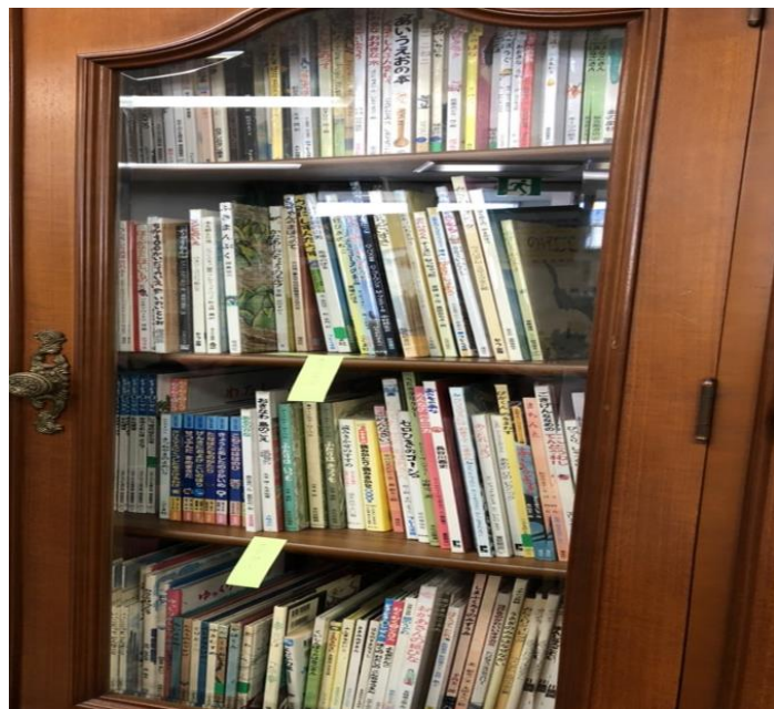
令和元年度購入の一部